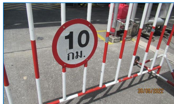
ภาพถ่ายที่ 2.2-16 ป้ายเตือนจำกัดความเร็วในพื้นที่โครงการ