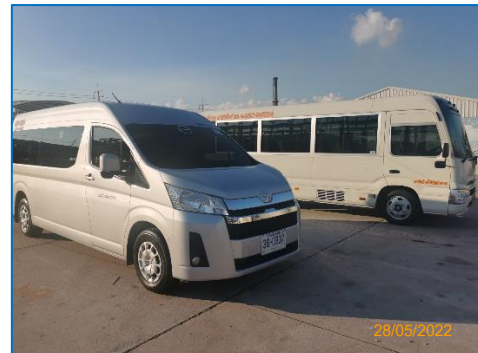
ภาพถ่ายที่ 2.2-20 รถรับ-ส่งพนักงานบริษัท