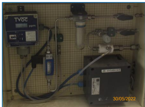
ภาพถ่ายที่ 2.2-7 Phenolic Online Analyzer