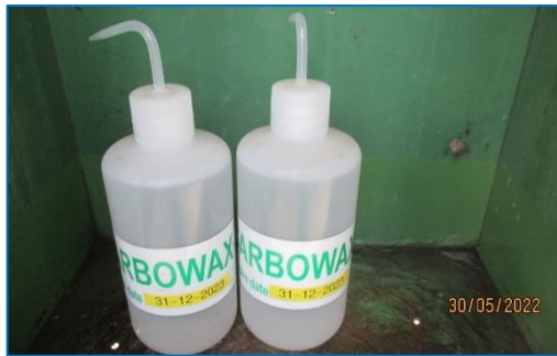
ภาพถ่ายที่ 2.2-25 Carbowax