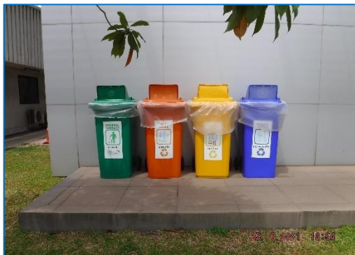
ภาพถ่ายที่ 2.2-13 ถังขยะแยกประเภท