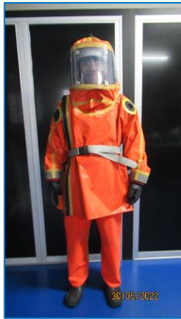
ภาพถ่ายที่ 2.2-23 ชุดป้องกันสารเคมี