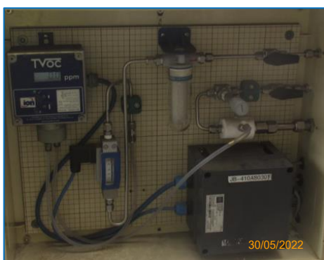
ภาพถ่ายที่ 2.2-3 อุปกรณ์ TOC Online