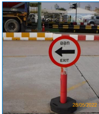
ภาพถ่ายที่ 2.2-17 ป้ายเครื่องหมายจราจรในพื้นที่โครงการ