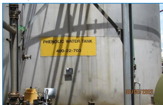
ภาพถ่ายที่ 2.2-4 Phenolic Water Tank