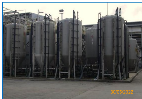
ภาพถ่ายที่ 2.2-6 ระบบดูดซับด้วยถ่านกัมมันต์ ส่วนผลิต PC