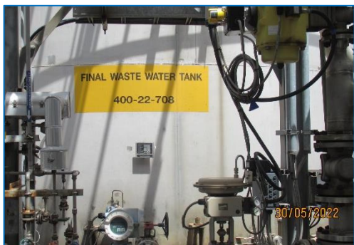
ภาพถ่ายที่ 2.2-5 Final Wastewater Tank