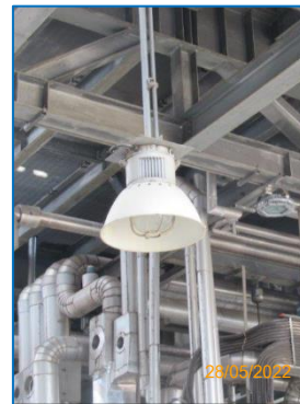
ภาพถ่ายที่ 2.2-18 ไฟส่องสว่างภายในพื้นที่โครงการ