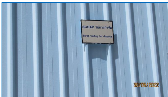
ภาพถ่ายที่ 2.2-15 Scrap Area