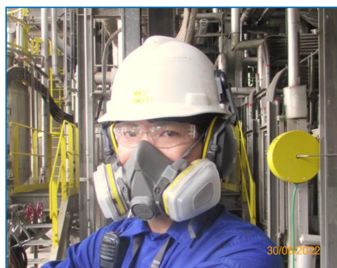
ภาพถ่ายที่ 2.2-2 อุปกรณ์ป้องกันอันตราย ส่วนบุคคล (PPE) สำหรับพนักงานที่สัมผัสกับเสียงดัง