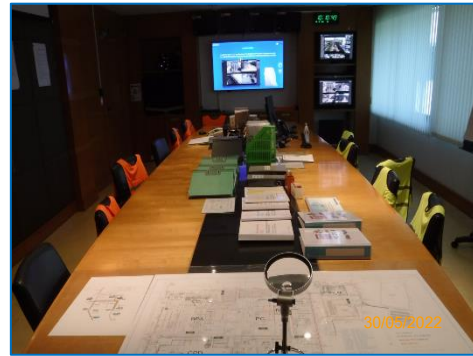
ภาพถ่ายที่ 2.2-30 ศูนย์ปฏิบัติการควบคุมภาวะฉุกเฉิน (ECC)