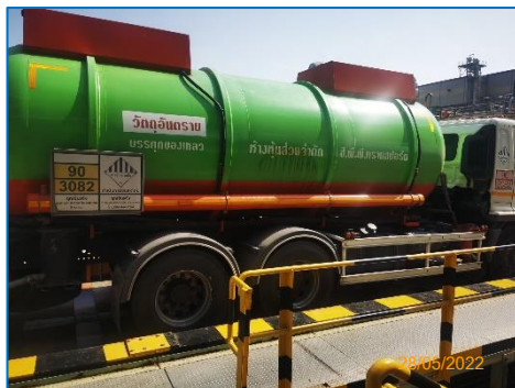
ภาพถ่ายที่ 2.2-19 รถขนส่งวัตถุดิบและสารเคมี