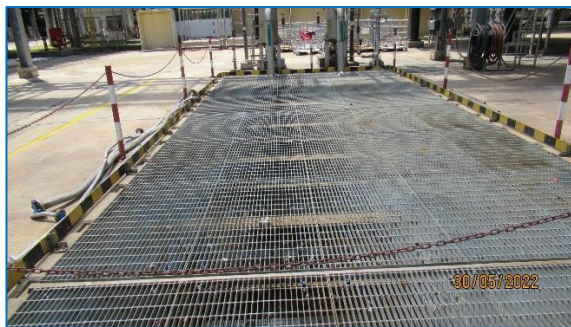
ภาพถ่ายที่ 2.2-11 Process Wastewater Sump