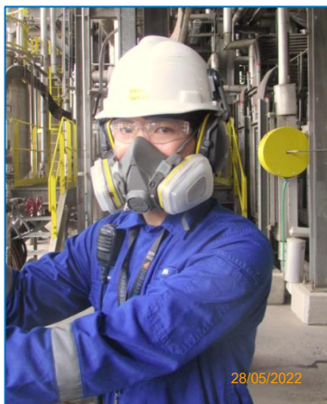
ภาพถ่ายที่ 2.2-21 หน้ากากป้องกันสารเคมีชนิดดัดกรอง