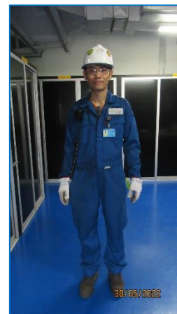
ภาพถ่ายที่ 2.2-22 พนักงานสวมใส่อุปกรณ์ป้องกันอันตราย ส่วนบุคคลขณะปฏิบัติงาน