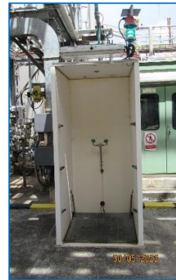
ภาพถ่ายที่ 2.2-26 ฝักบัวชำระลูกเดิน