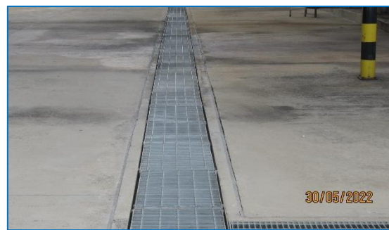
ภาพถ่ายที่ 2.2-12 รางระบายน้ำภายในพื้นที่โครงการ