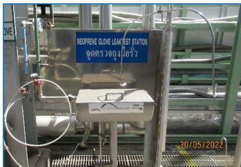
ภาพถ่ายที่ 2.2-27 จุดตรวจสอบถุงมือรั่ว