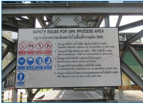
ภาพถ่ายที่ 2.2-29 กฎระเบียบความปลอดภัยในพื้นที่การผลิต