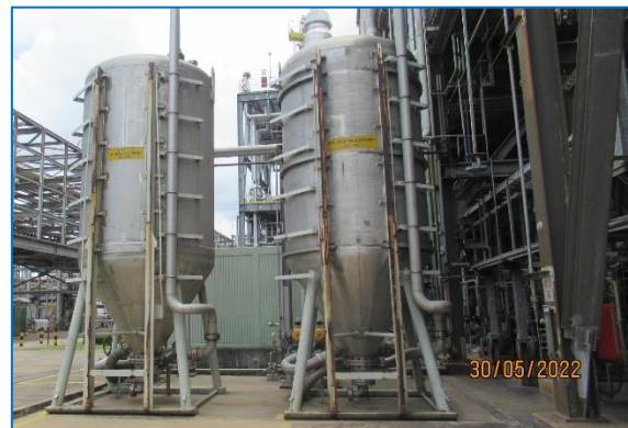
ภาพถ่ายที่ 2.2-10 Activated Carbon Adsorber