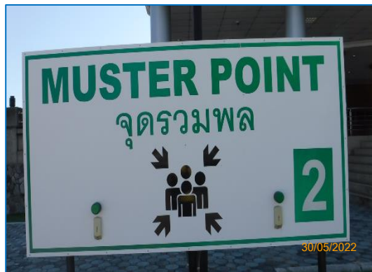
ภาพถ่ายที่ 2.2-31 จุดรวมพลของโครงการ