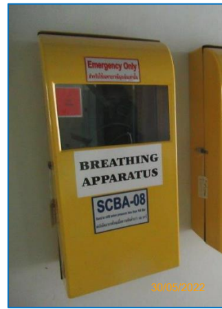
ภาพถ่ายที่ 2.2-24 Breathing Apparatus