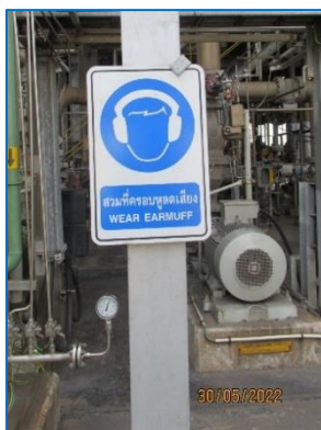
ภาพถ่ายที่ 2.2-1 ป้ายเตือนให้สวมใส่อุปกรณ์ป้องกันเสียงดัง